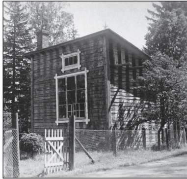
Ateljén vid Tomtebo uppfördes redan 1886. Den hade ursprungligen ingen panel utan målades direkt på stockarna med röda och vita ränder som en jättelik badkabin.