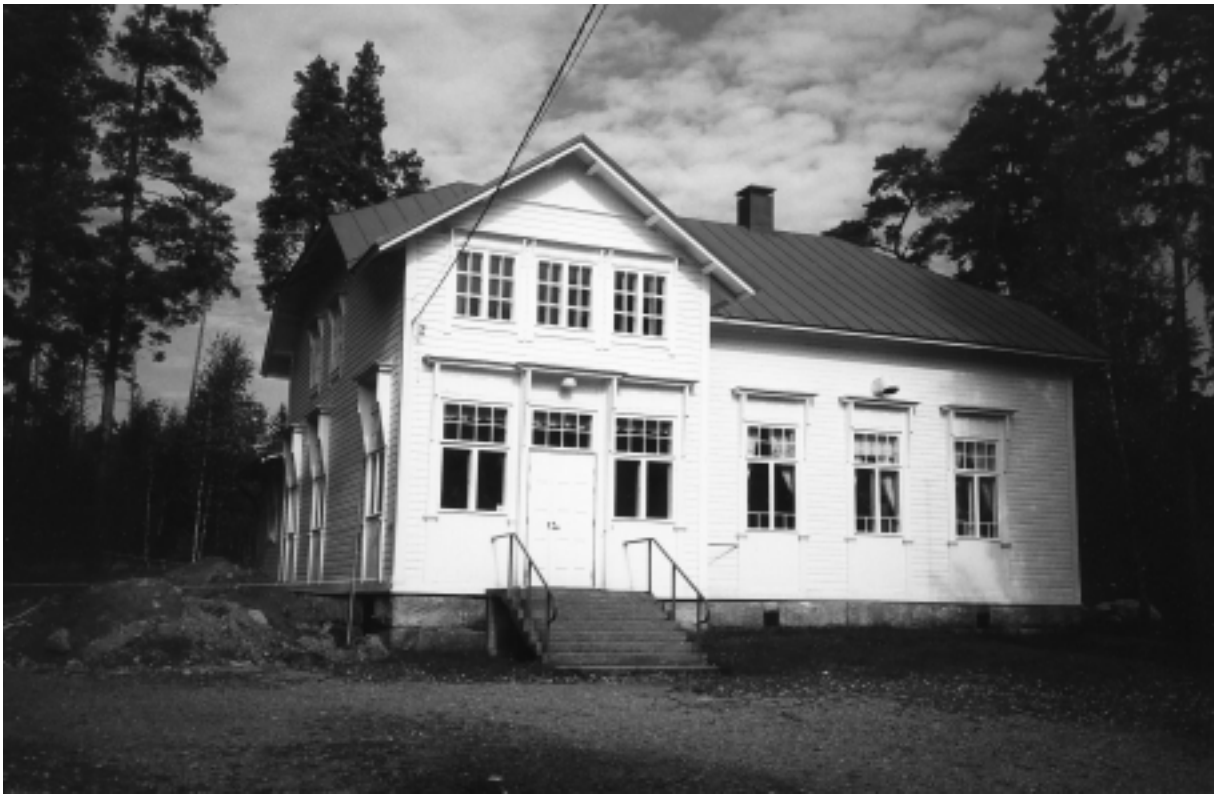
Emsalö Allmogeförenings hus, "Midgård", byggt 1912.