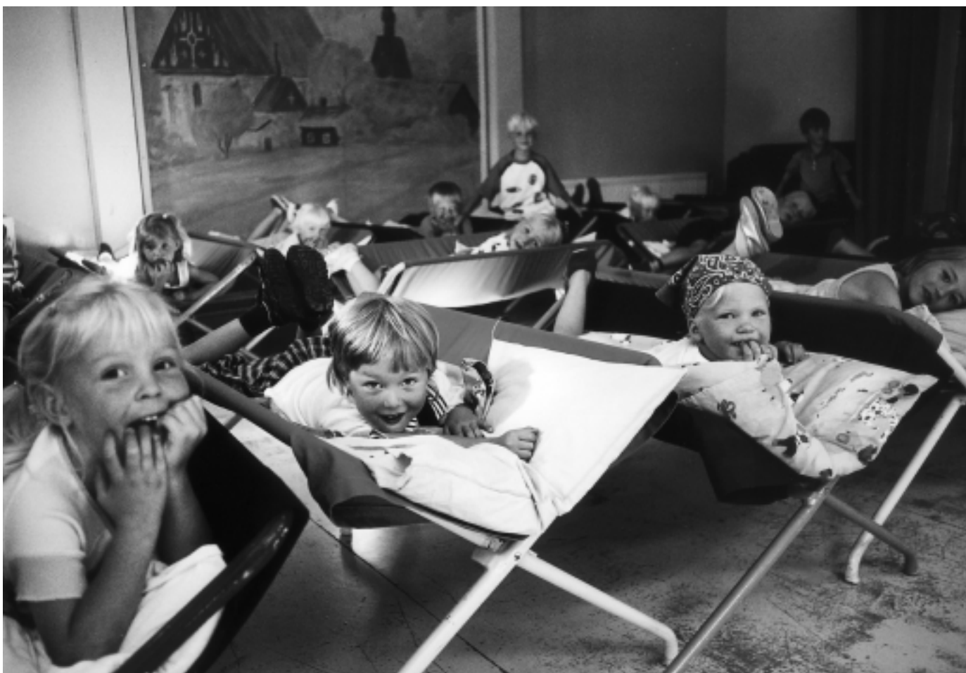
Föreningen samsas om utrymmet med Folkhälsans daghem. Dagsbarnen tar siin tupplur på föreningshusets scen.

finska deltagare i vår verksamhet, folk kommer med för att de är intresserade, oberoende av språket.