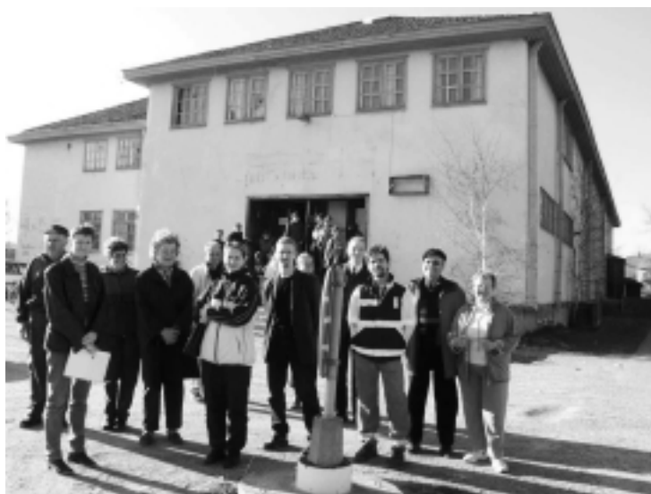
Föreningshuset i Pargas