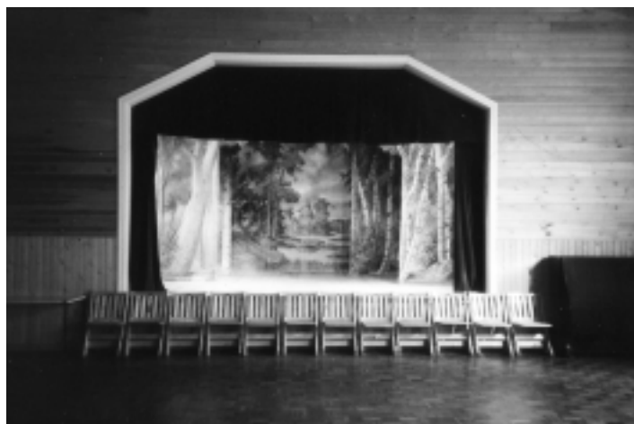
Finlands äldsta föreningshus, FBK-huset i Åbo, byggt 1892.