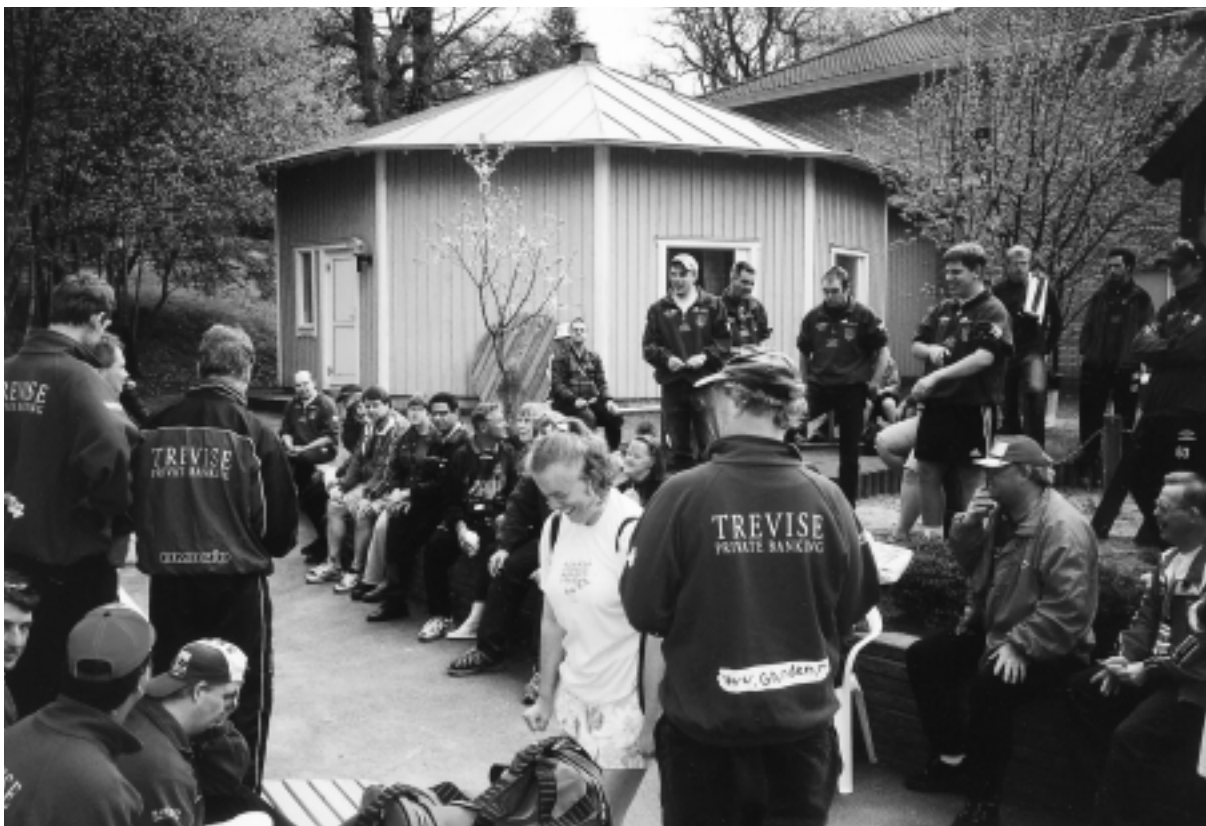
I boll- och idrottssektionen, Grunden BOIS, får alla som vill vara med och spela.

Grundens verksamhet har vuxit hela tiden. Grunden Media är en redaktion som gör information som är lätt att förstå. Där görs tidningar, videofilmer och radioprogram. Arbetet sker i grupp och redaktionen poängterar öppenhet inför nya idéer.